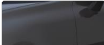
Panthera Metal (P2M)