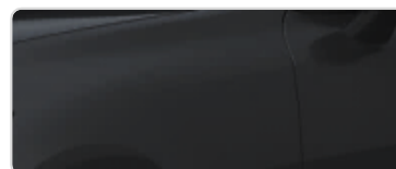
Aurora Black (ABP)