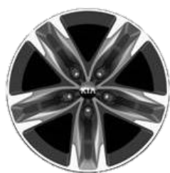
2.2D XL: 17" aluminiowe obrycze kół z oponami w rozmiarze 225/50R17