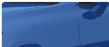
Micro Blue (M6B)