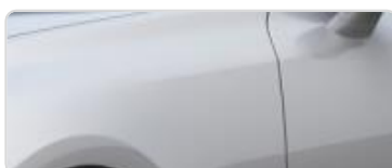
Silky Silver (4SS)