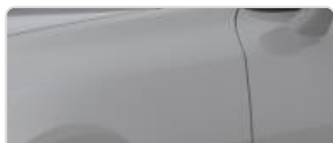
Ceramic Silver (C4S)