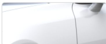
Pearl White (SWP)

Lakier specjalny „High Chroma Red”: 4 000 zł