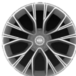
GT Line: 19" aluminiowe obrycze kół z oponami w rozmiarze przód: 225/40 R19 tył: 255/35 R19