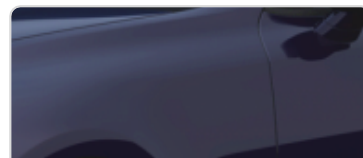
Deep Chroma Blue (D9B)