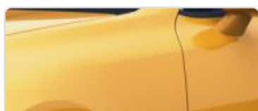
Sunset Yellow (S7Y) bez dopłaty