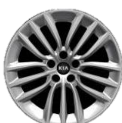
2.0T L, XL: 18" aluminiowe obrycze kół z oponami w rozmiarze 225/45R18