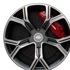
GT: 19" aluminiowe obrycze kół z oponami w rozmiarze przód: 225/40 R19 tył: 255/35 R19